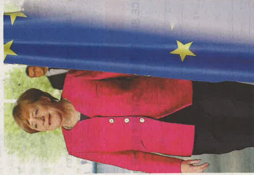
如果德國同意歐盟採取一個基於正當程序、經濟融合和民主問責的嶄新聯邦制藍圖，有理由相信，德國將會再次成為一個熱心的歐盟成員國，而不僅僅是歐盟內的一名管工。圖為德國總理默克爾。

因此，我們正在修訂德國退出歐盟和彌善其身，與支持歐盟進一步一體化的或然率。在今年1月份，德國孤身走我路的可能性高達大約60%，但現時已明顯低於50%。