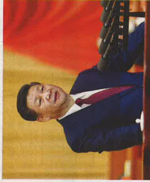
早前結束的「十八屆六中全會」發放出來的信息相當混亂。一方面習近平(圖)被確認為「核心領導人」，另一方面，該會議的官方公布卻充斥着「集體領導」的字眼。(資料圖片)

以我們所知，這些都是習近平自己的核心觀點，並不是因為他缺乏權力去推行改革，才採取這些戰術立場。習近平的立場似乎是，經濟改革是好的，但前提是它不